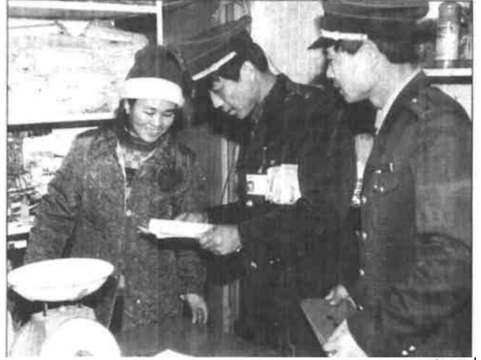
市区国税局胜利分局在征管工作中注重税法宣传，坚持“税收到哪里，就把税法宣传到哪里”，受到纳税业主一致好评。图为分局的同志在向一业户讲解有关收税法。

决策城市道路功能问题，而公共交通是效益最高的交通方式，载客量、相对占有道路面积、百公里油耗、尾气排放等与小汽车相比较均优于10倍以上。同时，公共交通又是社会生产的第一道工序和总环节，是城市建设和发展的基础，其所创造的价值体现在国民经济的总体效益之中，因此，对具有公益性质的城市公共交通必须采取重点扶持政策，并纳入国民经济和社会发展的规划和计划中，予以优先发展。还需指出的是，公交优先是一项战略，它必须长期实施，而不是短期权宜之举，也不是某项单一措施。它涉及道路使用(如北京、济南市的公交车专用道)、交通法规、投资、补贴、票制、票价改革和客运市场管理等方面，公交优先的实质是群众优先、百姓优先。 二是应建立城市客运管理机构，即设立“东营市城市客运管理局”或城市客运管理处。凡经营城市短途客运业务的公交出租行业，无论其所有制成份如何，均纳入该管理机构，该局的主要职责可为：根据我市的现状和发展制订运营规划，制订并出台客运行业政策法规和经营规范；对客运市场进行管理，对客运实体的准入及经营区域和范围实行宏观调控；监督城市客运行业贯彻执行政府有关政策法规；以政策为杠杆调控各客运单位生产方式和经营规模，协调各方面关系和平衡相互之间的利益。 三是保持和完善政府对国有公交企业的优惠政策。公交企业追求社会效益性和生产经营性的双重性质，决定了它既要承担政府对市民的承诺，又要追求价值和利润，因而必须同时兼顾社会效益和经济效益，公交企业成了一种对矛盾的集合体。如从其他一些城市的教训来看，个体和私营企业参与公交运营是以赢利为目的，他们可以灵活出击，见空就钻，抢客倒客，唯利是图。而国营公交讲求双重效益，无论高峰低谷，也不管人多少，都要正点发车，尤以社会效益为重，这就使得国营公交与社会、个体运营车辆不在一个竞争水平线上。更为严重的是无宏观控制地增加车辆，势