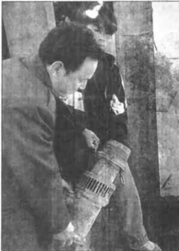
河口区新户乡5.8万亩海水养殖区于近日开始蓄水,他们抓住目前水质好的有利时机,力争早蓄水、早投苗,争取新年第一个海水养殖大丰收。图为海水引管。